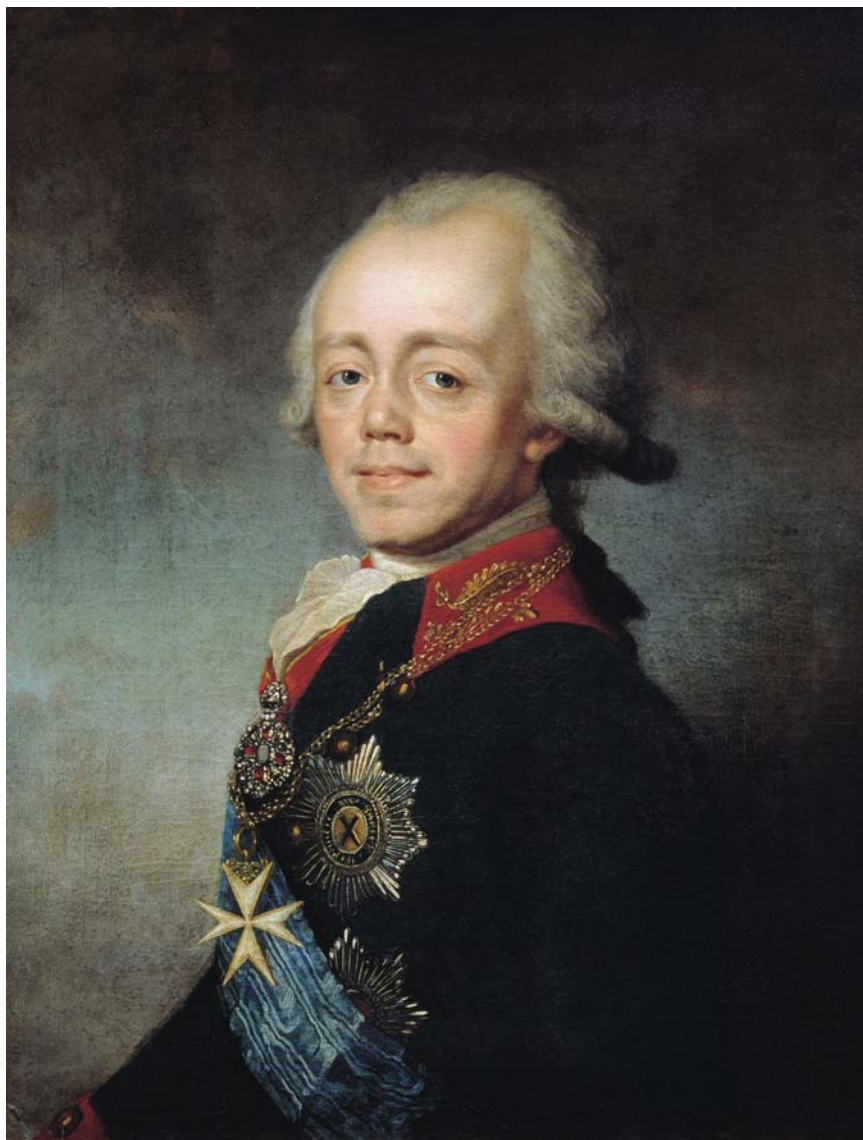
Степан Семёнович Щукин – Портрет Российского Императора Павла I – 18. век

Stepan Semyonovich Shchukin – Portrait of Paul I – XVIIIth century